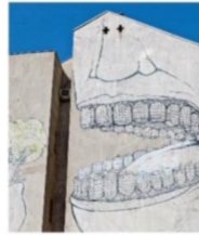
..... Pittura realizzata sulle pareti, specialmente quelle esterne degli edifici