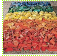
Rifiuti..... Materiali di scarto utilizzati in alcune correnti artistiche

Per colpire lo spettatore con qualcosa di inaspettato