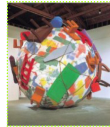
..... Opera d'arte che consiste nella creazione di un ambiente nel quale sono disposti gli oggetti